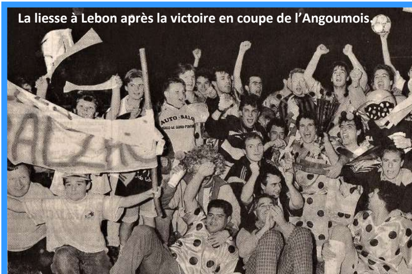
La liesse à Lebon après la victoire en coupe de l'Angoumois.