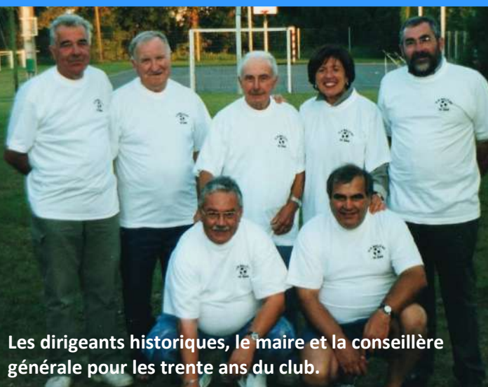
Les dirigeants historiques, le maire et la conseillère générale pour les trente ans du club.