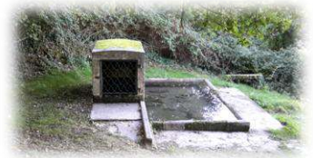
La fontaine de la Font Saint Martin