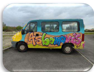
Conducteur de car