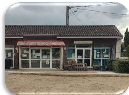
Directeur Maison des Jeunes en cours de recrutement