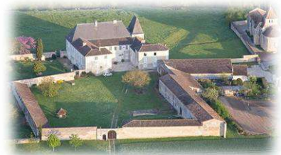
Le château et l'église