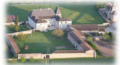
Le château et l'église